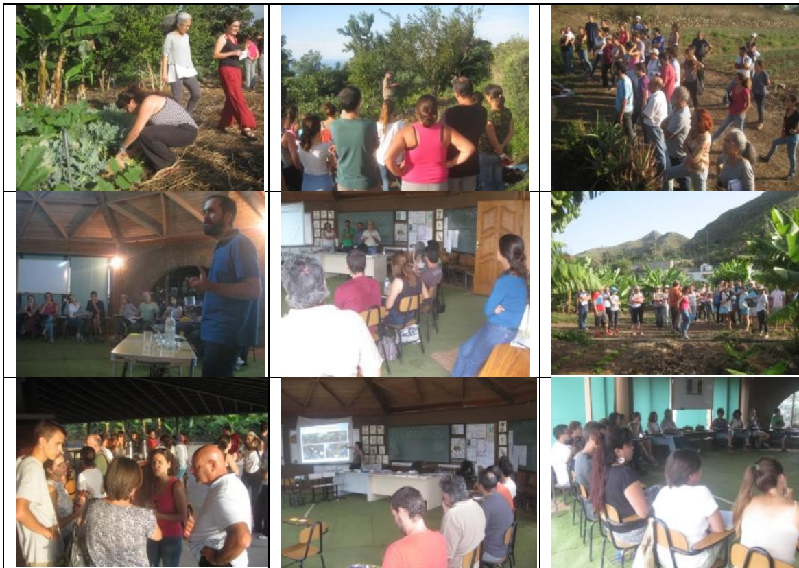
Tabla de EXPECTATIVAS del Módulo III