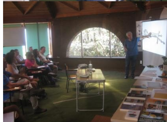
Tabla de EXPECTATIVAS del Módulo II